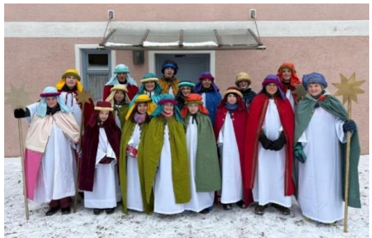
(Sternsinger v. Seyboldsdorf)