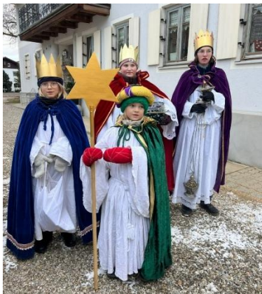
(Sternsinger v. Gaiendorf)

Gerade in Zeiten, in denen zahlreiche Konfliktherde und Naturkatastrophen unsere Welt erschüttern und eine Krise die nächste jagt, ist es wichtiger denn je, an die Hilfesuchenden weltweit zu denken! Mit den Spenden der diesjährigen Sternsingeraktion werden Projekte unterstützt, die sich dafür einsetzen, dass Kinder aus Arbeitsverhältnissen befreit werden und ihnen der Schulbesuch ermöglicht wird. Mit der Aktion Dreikönigssingen setzen sich die Sternsinger/-innen auch dafür ein, dass sich in einem Land wie Bangladesch, in dem trotz Fortschritten im Kampf gegen Kinderarbeit noch rund 1,8 Millionen Kinder und Jugendliche arbeiten – 1,1 Millionen sogar unter besonders gesundheitsschädlichen und ausbeuterischen Bedingungen, die Lebensbedingungen verbessern und wollen mit ihrem Engagement ein Zeichen setzen, dass es gilt, Kinderrechte weltweit zu bewahren und insbesondere Kinderarbeit abzuwenden.