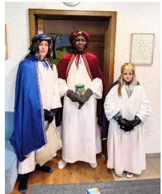
(Sternsinger v. Haarbach)

Die Sternsinger sagen ein herzliches „Vergelt's Gott“ für die freundliche Aufnahme und Ihre Spenden!