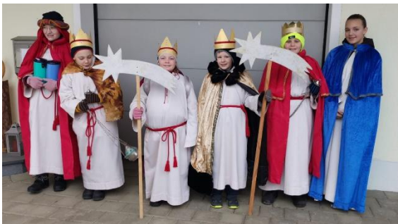
(Sternsinger v. Englberg)