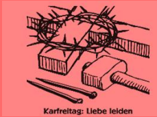
Karfreitag: Liebe leiden