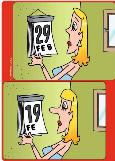
Finde die acht Fehler