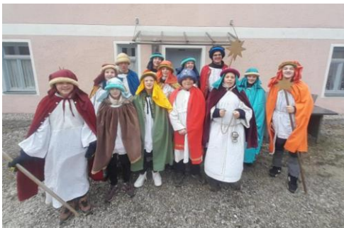
(Sternsinger v. Seyboldsdorf)