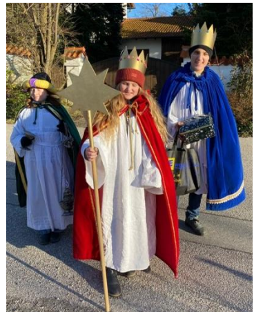
(Sternsinger v. Gaindorf)